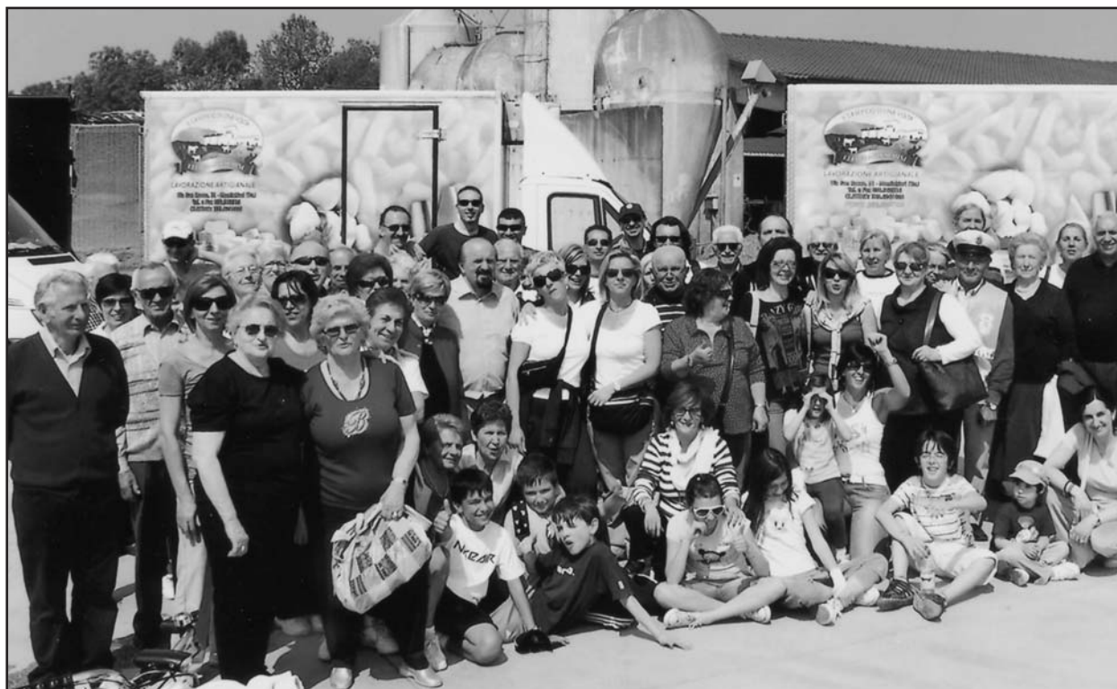
Il gruppo dei partecipanti accolto nell'Azienda agricola dei Fratelli Franceschini, Caseificio di una Volta.

Come accade da diversi anni, domenica 25 aprile il Centro Diurno casa Bianca di Montichiari, ha organizzato una bicicletтата, alla quale hanno partecipato molte persone.