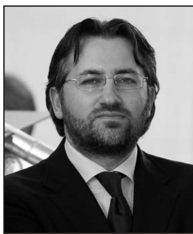
Gli immigrati indispensabili per Montichiari.

I l gruppo Escursionisti in collaborazione con il gruppo alpini di Montichiari, venerdì 21 maggio 2010 alle ore 21.00, nella nuova sede degli alpini (via Pellegrino da Montechiaro, 2) presentano: "Espedi-