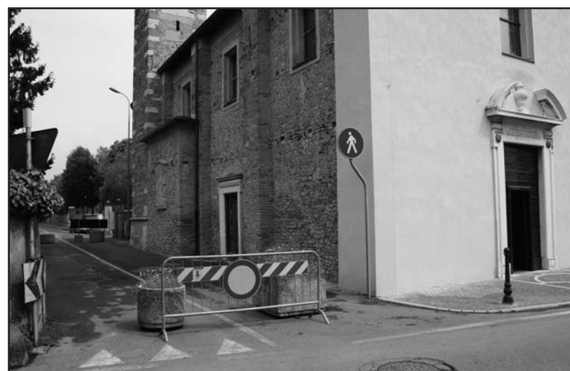
La via dei Novagli "interrotta".